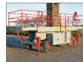
Plataforma bajada con los 4 estabilizadores bajados