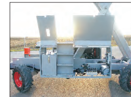
Deposito aceite y componentes hidráulicos