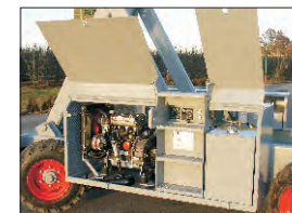
Motor Diesel, Deposito de gasoil y panel de arranque