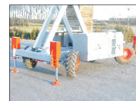
Plataforma subida con los 4 estabilizadores bajados